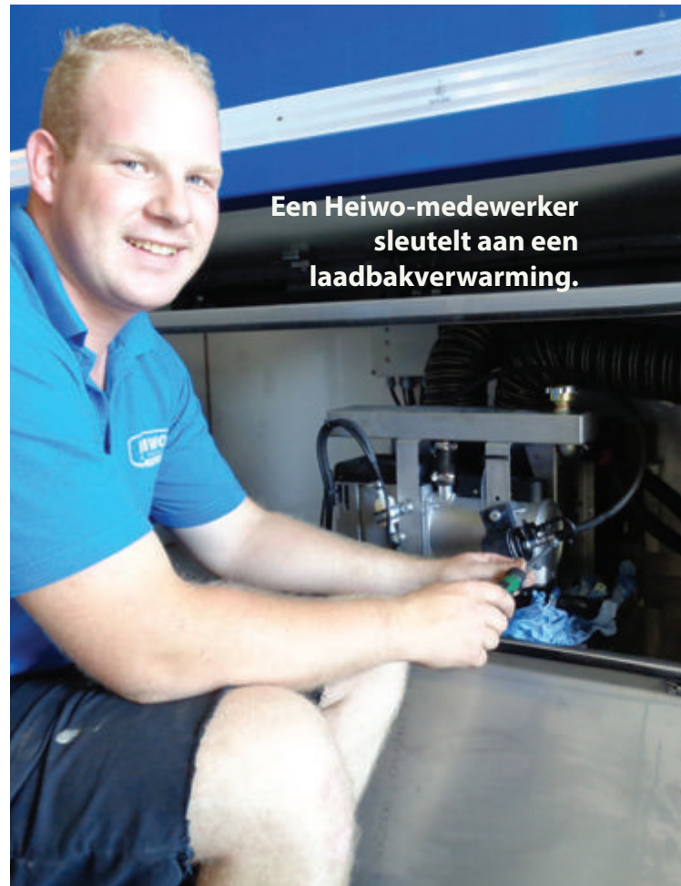
Een Heiwo-medewerker sleutelt aan een laadbakverwarming.

Volgens Arco Bergwerff is de ultieme vorm van maatwerk de grote toegevoegde waarde van Heiwo. "Niets is standaard, de mogelijkheden om een trailer, truckbak of aanhanger volledig naar eigen wensen in te richten zijn enorm. Dat moet ook wel,